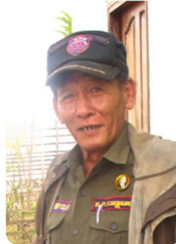
Ja Chauffeur de tuktuk