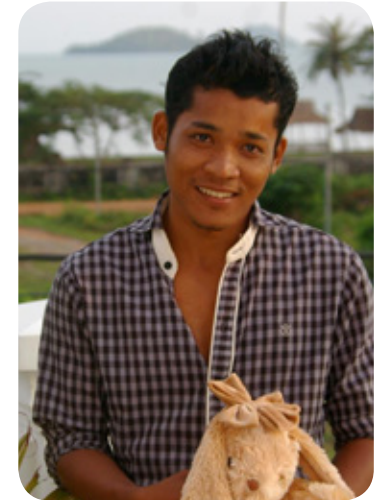
Khet Coordinateur local